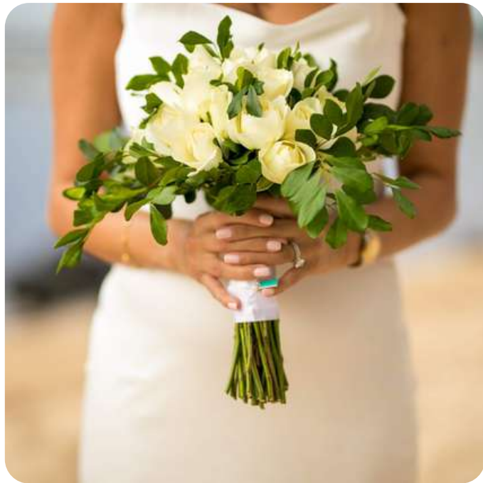
🌸 Bouquet de mariée : 70 € – 90 €

Nous vous enverrons notre collection afin que vous puissiez choisir le bouquet qui vous plaît le plus !